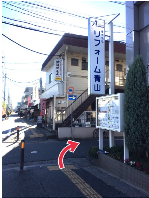
リフォーム青山 右折 Turn right 「リフォーム青山」