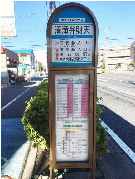
東京ベイシティバス 「清滝弁財天」停留所下車 The bus by Tokyo bay city Get off 「Seiryu-benzaiten」