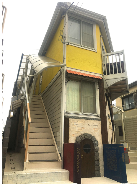
直進し、左手の黄色い建物です Go straight and you can find the yellow building on the left side.